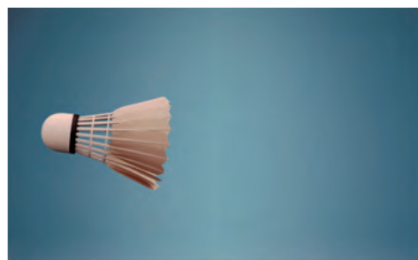
Il volano ....