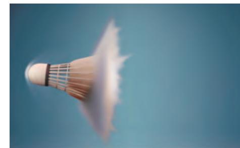
la rottura del muro del suono....